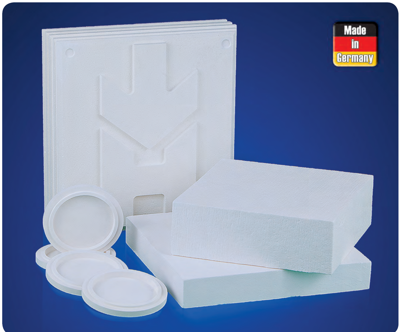
Konturgefräste Bauteile aus Halfoam Alumina™

Halfoam Alumina™ is fibre free, dust due to machining is not critical. Contamination of the fired articles by fibres is eliminated. To summarise, Halfoam Alumina™ is a universal and very versatile high temperature insulation material with a broad range of potential applications.